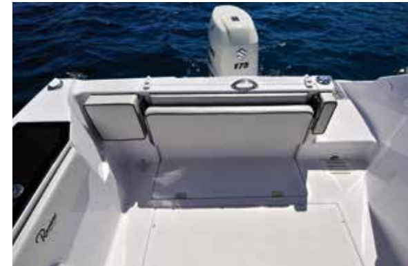
DIVANO APERTO E CHIUSO - Due sono le modalità d'impiego del divano in pozzetto. Chiuso quando si pesca, aperto quando si naviga o staziona