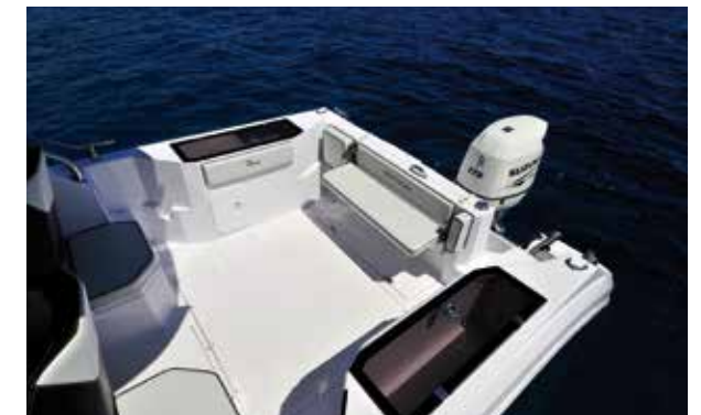
POZZETTO - Il pozzetto misura 2,5 mq e lascia spazio sufficiente per pescare con gli amici senza darsi fastidio

Le murate sono imbottite internamente e pertanto sono confortevoli quando ci dobbiamo appoggiare per pescare