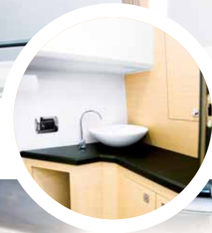
Sopra, la bella stazione di governo, a lato il bagno; sotto, la dinette trasformabile in letto matrimoniale per la notte.